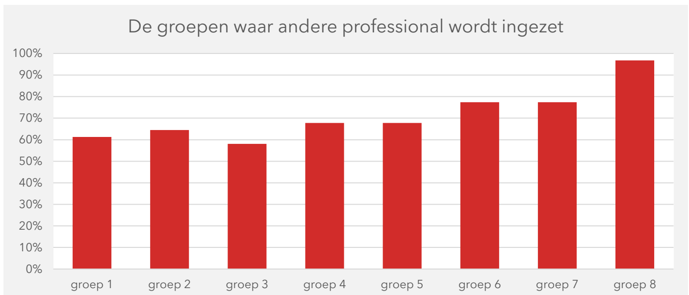
Figuur 2 In groep 8 wordt het vaakst een andere professional ingezet