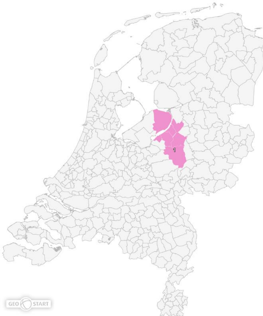
Figuur 1. Gedefinieerde regio subsidieaanvraag vo-mbo regio Noordwest-Veluwe

Deze aanvraag heeft betrekking op de gedefinieerde regio maar dit neemt niet weg dat andere besturen in de nabije omgeving van de regio betrokken worden (en blijven) bij de activiteiten en programma die in deze aanvraag worden beschreven. Zie ook bijlage A voor een toelichting op de totale regio en de samenwerking.