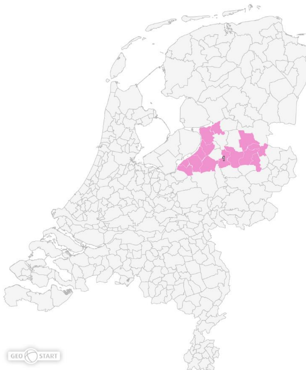
Figuur 1. Gedefinieerde regio subsidieaanvraag po regio “Veluwe en Salland”

De subsidieaanvraag regio “Veluwe en Salland” is primair gericht op de regio zoals weergegeven in figuur 1, en omvat de gemeenten Elburg, Epe, Ermelo, Harderwijk, Kampen, Nunspeet, Oldebroek, Olst-Wijhe, Raalte, Zwartewaterland, Ommen, Twenterand, Wierden en Hellendoorn. Bij het definiëren van de regio zijn de gemeentegrenzen leidend. In totaal participeert 39% van het aantal besturen in de regio, wat 2260 fte vertegenwoordigd (68% van het totaal aantal fte in deze regio). Deze aanvraag heeft betrekking op de gedefinieerde regio maar dit neemt niet weg dat andere besturen in de nabije omgeving van de regio betrokken worden (en blijven) bij de activiteiten en het programma die in deze aanvraag worden beschreven. Zie ook bijlage A voor een toelichting van de totale regio en samenwerking.